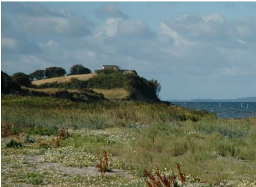
Franke Klint set fra nordvestlige spids.